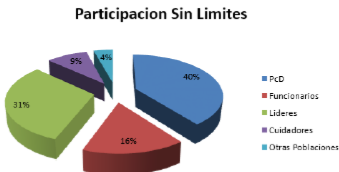
Gráfica 3. Porcentaje de participación por tipo de asistente

Como se puede evidenciar en la Gráfica1, el 40% de las personas que asistieron a los talleres de "Participación sin Límites" corresponden a personas con discapacidad lo que demuestra que el objetivo de incluir a las personas con discapacidad y dar a conocer derechos y deberes de dicha población, se cumplió. Adicionalmente, es importante resaltar la participación de Funcionarios públicos municipales en los talleres lo que demuestra un interés por participar en espacios de reconocimiento de leyes que impactan la población que atienden.